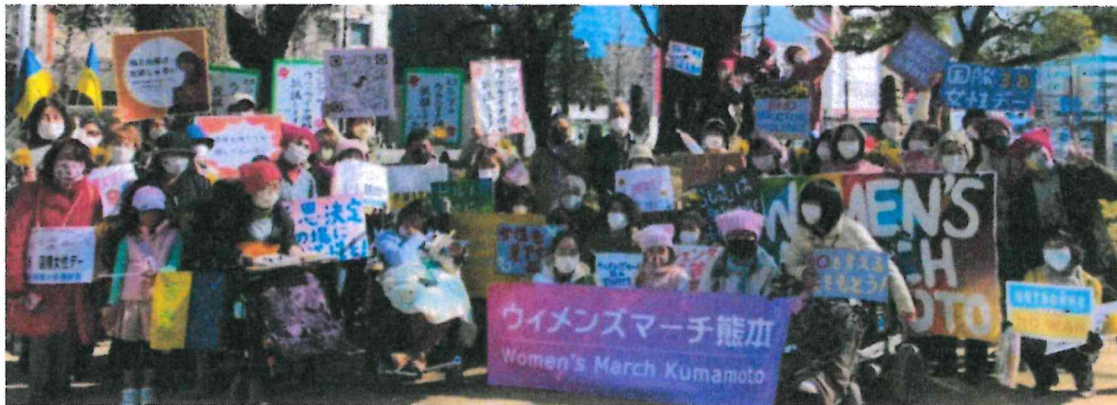
↑ 昨年のウィメンズマーチ

たちはウィメンズマーチで連帯し、一緒に声を上げ続けます。ジェンダーに基づいた差別や偏見を生み出す社会構造を変え、関わらず誰もが自分の未来を切り開けるよう、一緒に歩きましょう！！